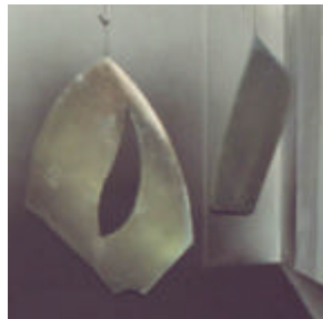
Techo realizado en base a plantilla esc. 1:1