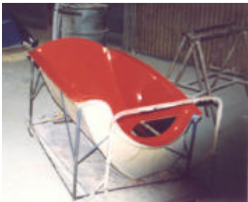
Molde realizado en base a plantillas esc. 1:1