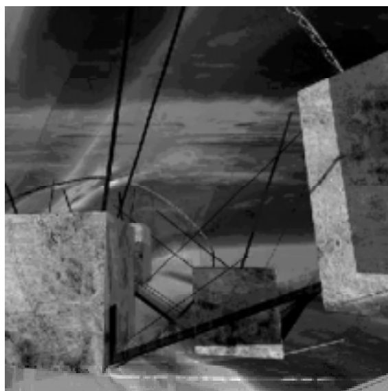
Fig 5. Toledo, Caseaux, Tamagnone, Peruzzo