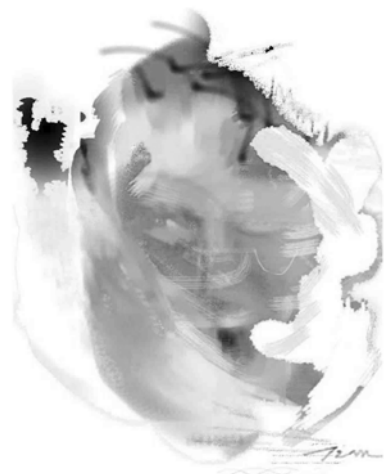
Figura 1 "Criminal"

La utilización del medio digital aplicado al retrato posibilita tener una mirada interior de las personas, de la misma manera que una cebolla, a través de transparencias, halos, superposiciones, claroscuros, desmaterializaciones, etc. Este proceso me ha permitido formas de expresión que pueden darnos indicios acerca de la esencia de la persona retratada, que no solamente son referidas a su aspectos morfológicos sino aquellas que sugieran cuestiones intangibles que hacen al espíritu del ser humano.