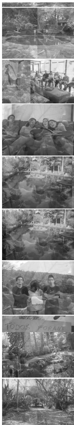
Figura 3: Atividades durante o curso de PinhalDigital em 2003.

Os dois últimos dias foram passados nos laboratórios do Departamento de Arquitetura e Urbanismo da EESC-USP, onde cada grupo tinha como objetivo organizar o material levantado de forma a permitir a integração dos conteúdos no ambiente digital. A terceira fase, prevista para dezembro, deverá propor a primeira interface multimídia em formato de um cd-rom, permitindo acessos dinâmicos, não-lineares e interativos aos diversos conteúdos em relação ao objetivo inicial de mostrar a construção e o funcionamento da tulha e o processo do café da Fazenda Pinhal. A experiência boa e construtiva do workshop teve outros desdobramentos como, por exemplo, a organização de disciplinas dentro dos currículos universitários para realizar anualmente pesquisas sobre o patrimônio e o vasto acervo da Fazenda Pinhal, reforçando, assim, os laços entre as duas universidades públicas e a Associação Pró-Casa do Pinhal. Como não tinha computador na Fazenda Pinhal, foi preciso de digitalizar tudo uma vez que voltasse da Fazenda para os laboratórios universitários. Isso de certa forma atrasou a fase 2 e não nos permitiu até hoje de iniciar a fase 3. Justamente sendo uma atividade transdisciplinar e trabalhando com pesquisadores de diferentes níveis, tivemos dificuldade de cruzar informações e de ter disponibilidade para se reunir.