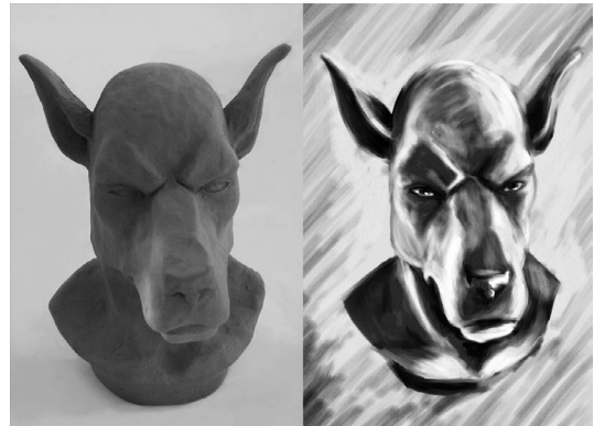
Fig. 2. Esquerda: maquete analógica. Direita: ilustração digital.

O próximo passo foi desenvolvido em meio digital. Para a ilustração utilizou-se o Corel Painter 12 . Este software não é um editor de imagens, mas sim uma forte ferramenta de simulação de materiais tradicionais analógicos voltada para a produção plástica artística. A maioria dos materiais conhecidos e populares têm seu